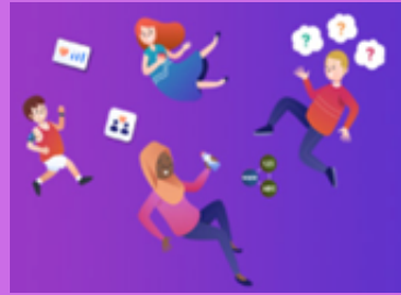
Iechyd a Lles / Health and Well-Being

Ein Cwestiwn Mawr / Our Big Question: Rhaid i ni adael y ddaear a mynd i'r blaned Mawrth! Pa heriau fydd yn ein gwynebu a sut allwn ni eu datrys? We need to leave earth for Mars! What cool challenges would we face living on Mars and how could we solve them?