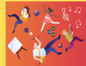
Y Celfyddydau Mynegiannol / Expressive Arts

Byddwn yn ymchwilio i ba broblemau neu heriau all godi wrth sefydlu cymdeithas ar blaned arall a hefyd sut y gall y penderfyniadau a wnawn heddiw effeithio ar ein dyfodol ein hunain, y gymuned a'r byd ehangach (W.M.3). Byddwn yn creu erthyglau perswadiol i annog ein cymuned leol i gadw'r Hendy yn ddaclus a chyflwyno ein dadl i'r Cyngor Cymuned (LLC W.M.2-3). We will investigate what problems or challenges may arise in establishing society on another planet and also how the decisions that we make today can impact on the future of ourselves, the community and the wider world (W.M.3). We will create persuasive articles to encourage our local community to keep Hendy tidy and and present our argument to the Community Council (LLC W.M.2-3).